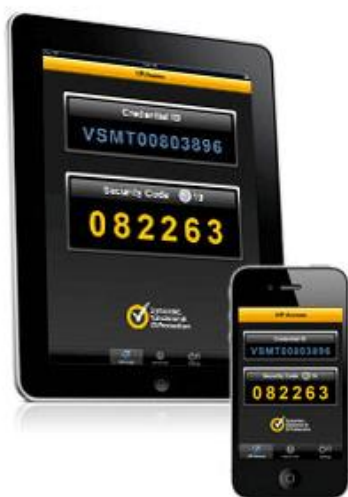
①スマートフォン (モバイル端末)

なお、ソフトウェアトークンは、お客さまがご使用のスマートフォン、パソコンにダウンロード (インストール) してご利用いただけます。