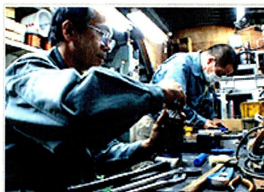
漁業用モーター製造する津川製作所