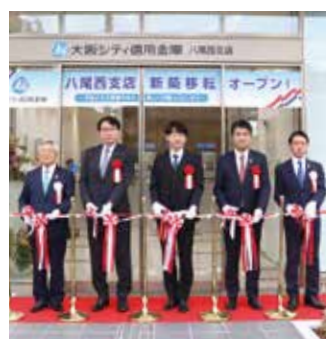
テープカットする関係者一同

外観はベージュを基調にして落ち着いた雰囲気演出。昇降式カウンターや税公金収納可能なATM、モバイルバッテリーシェアリングサービスを設置し、お客さまの利便性を高めました。オープニングセレモニーでは