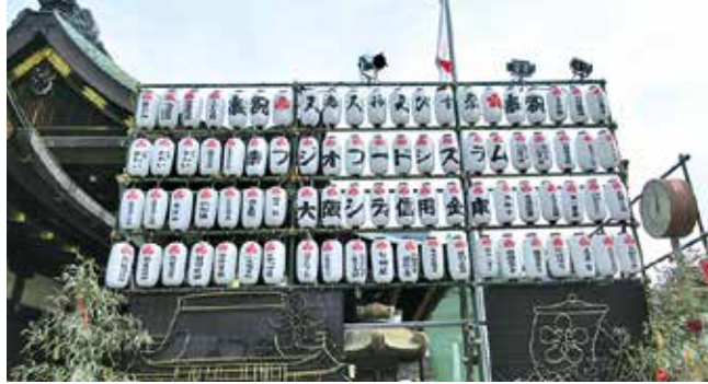
天満天神えびす祭に奉納した提灯

商売繁盛を祈願する「えべっさん」。当金庫は今年も、八尾戎神社「八日えびす」、大阪天満宮「天満天神えびす祭」、布施戎神社「十日戎」にそれぞれ協賛しました。八尾戎神社と大阪天満宮には提灯を奉納、布施戎神社では福笹に当金庫の名前を入れた縁起物を飾りつけ、商売繁盛を祈願しました。