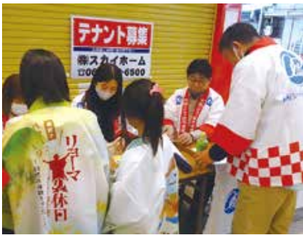
売上金の入金に対応する当金庫職員

当日は地元小学校3校のPTAが中心となって募集した小学生30人が4チームに分かれて、当金庫が協力を要請して仕入れた4県（群馬県、福井県、高知県、岡山県）の特産品の中から自分たちで選んだ品を販売し、売り上げや販売の早さを競いました。当金庫も模擬金融機関を出店し、売上金の入金や両替などを体験してもらいました。