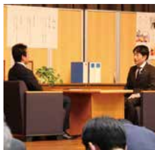
模範演技を披露する職員

昨年12月、お取引先支援に向けたコンサルティング機能の向上を目的に「顧客対応模範演技」を行い、職員6名がロールプレイング形式で模範演技を披露しました。