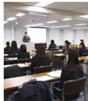
講演を聞く女性職員

2月2日、信金中央金庫が主催する外為研修交流会「外為女子会」が当金庫本店10階を会場に開催されました。