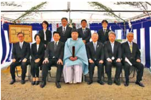
関係者一同で記念撮影