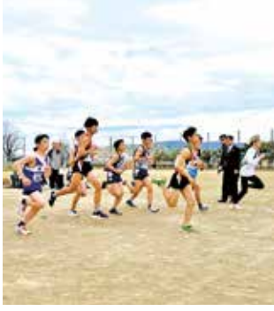
スターターの合図で走り出す第一走者