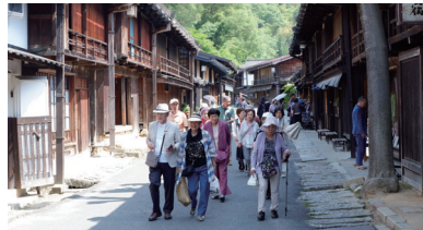
旅行会で散策を楽しむ会員の皆さま