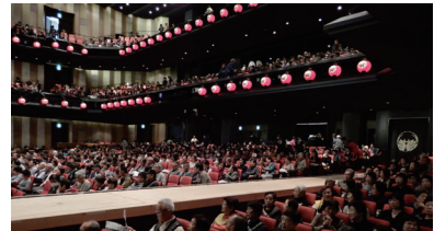
観劇会の会場を埋め尽くす会員の皆さま

※入会費、年会費等の費用は不要です。※「旅行会」「観劇会」につきましては、店頭へのポスター掲示によりご案内いたします。※詳細につきましては、当金庫本支店窓口にお問い合わせください。