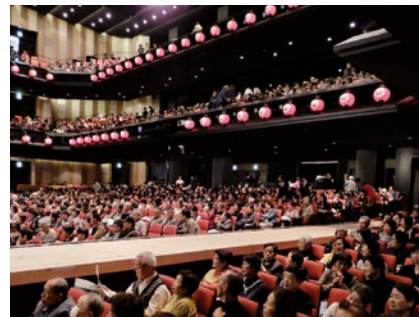
会員の皆さまで満席の観劇会の会場