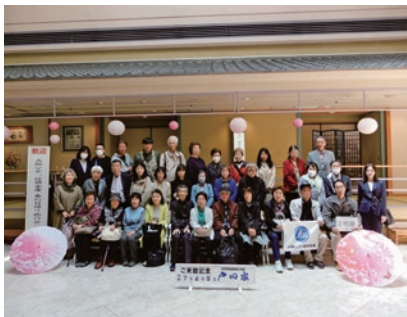
旅行会を楽しむ会員の皆さま

新たに定期預金をしていただく方のみとさせていただきます。*上乗せ利率は金利情勢により変動いたします。