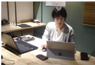
相談に対応するコーディネーター