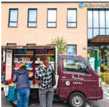
関目支店で開催した「走るデバ地下」

5月11日から20日まで、(株)阪急阪神百貨店とのコラボレーションにより、当金庫8支店で「走るデバ地下」サービスを開催しました。