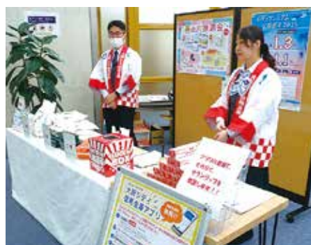
本店営業部ロビーで実施された抽選会