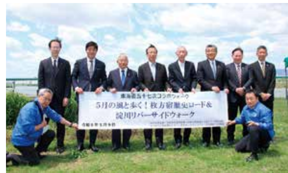
セレモニーでの記念撮影

5月9日、当金庫は、枚方信用金庫・京都中央信用金庫・京都信用金庫などと共同で「東海道五十七次コボウオーク」5月の風と歩く！枚方宿歴史ロード&淀川リバーサイドウォークを開催し、役員約190名を含む約1260名の方が参加しました。 同イベントは、江戸時代に整