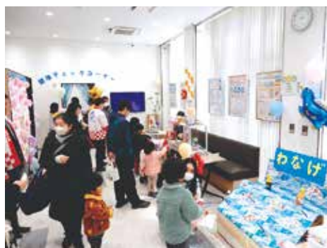
大勢の子もたちでにぎわう尼崎支店